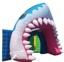
サメアーチ サイズ:D160×H430cm