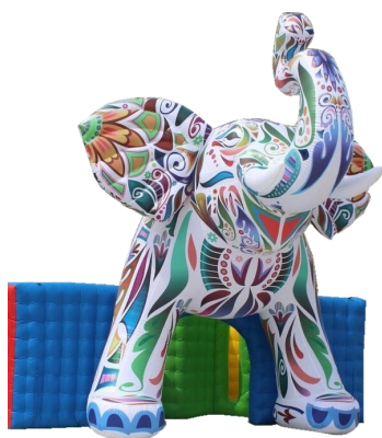
ぞうアーチ サイズ:D400×H550cm