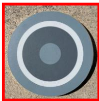
スタート/ゴール足場